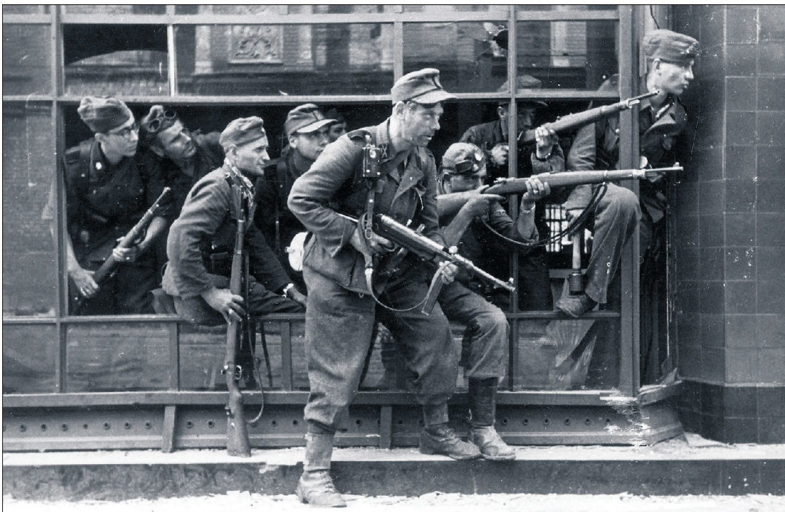
Mitglieder der SS-Sonderformation Dirlwanger während des Warschauer Aufstands im August 1944. Die Gruppe wird verantwortlich gemacht für zehntausende, teils bestialische Morde an polnischen Zivilisten.

„Wildieb-Kommando Oranienburg“ gegründet. Von den 88 Wilderern werden 55 Männer ausgewählt, die anderen kommen wohl aus gesundheitlichen Gründen nicht in Frage und müssen zurück in Haft. Später wird die Sonderformation, die ab dem 1. September mit dem Eintreffen des Oberstführers Oskar Dirlwangers nach ihm benannt wird, ins polnische Lublin verlegt. Schon vor dem brutalen Einsatz in Warschau begehen die Männer Verbrechen und töten zahlreiche Zivilisten in Weißrussland.